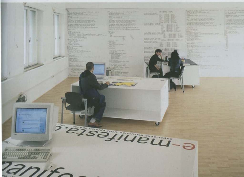
위 왼쪽 · <포스트캐피탈 포토몽타주(Postcapital Photomontage)> 2008 | 오른쪽 · <포스트캐피탈 포토몽타주> 2008 아래 · <e-manifesta.org> 제4회 마니페스타 전시 장면 2002 왼쪽 페이지 전시 <포스트캐피탈> 슈투트가르트 뷔르템베르گی세르쿠스스페어라인 (WKV) 설치 장면 2008

■ 다니엘 가르시아 앙두하르 1966년 스페인 알모라디 출생. 현재 바르셀로나 거주. 1980년대 후반부터 비디오 영역 위주로 활동하고 있다. 1996년부터 온오프라인 프로젝트 <TTTP> (포스트캐피탈 아카이브) 등 진행. 2000년 홍콩 마이크로웨이브페스티벌, 2006포르테스파나 2009베니스비엔날레 등 참가. 1999년 칼스루헤 ZKM, 2006년 도르트문트 HMKV 등에서 전시. 한국에서는 2009년 토탈미술관에서 워크숍을 진행, 2010년 <포스트캐피탈 서울>전을 개최할 예정이다.