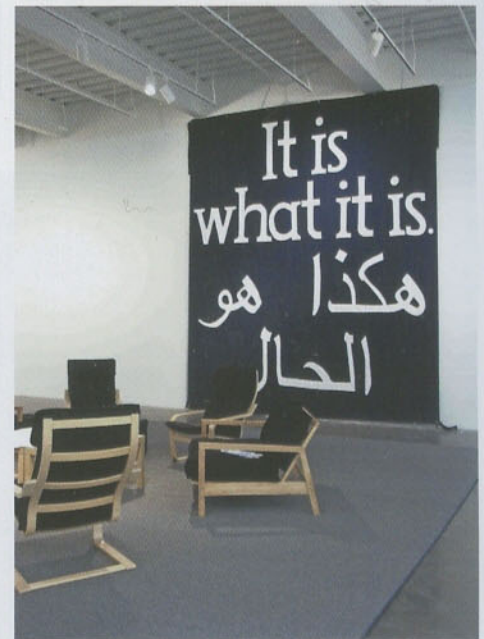
제레미 델러 (이라크전에 대한 대화) 2009 뉴욕 뉴뮤지엄 왼쪽 페이지 위 · 차오 페이 (차이나 트레이시- 아이 미러) 영상 28분 2007 | 가운데 · 랜디 & 캐트린 (Super Sweet-Twistee Treat-16 Flavours-Its A World In It Self) 2007 | 아래 · 다니엘 가르시아 앙두하르 (개인적 시민 공화국 프로젝트) 2003 앞 페이지 플라비아 다 린 (무제) 랩다프린트 100×100cm 2006~2007