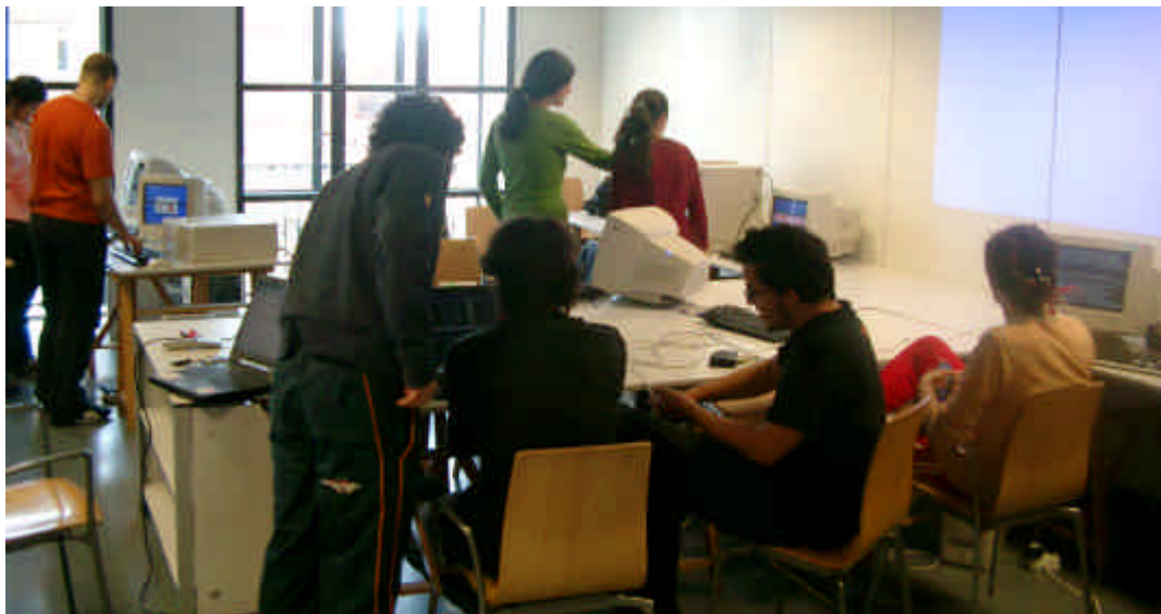
Basurama05. La Casa Encendida, Madrid, 2005

caS. Torneo 18, Sevilla / Santa Clara 91, Sevilla.