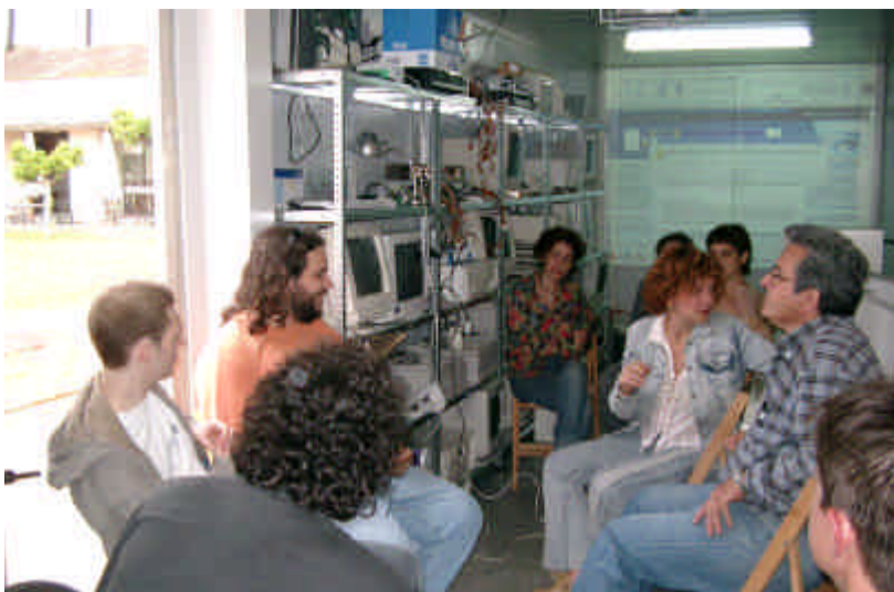
Open Space. Centro Andaluz de Arte Contemporáneo, Monasterio de la Cartuja de Santa María de Las Cuevas, Sevilla, 2004